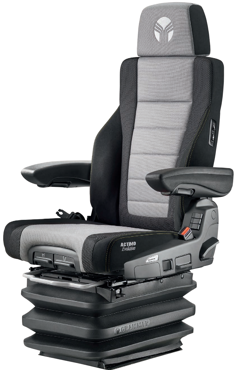
Abbildungen können von Serienausstattung abweichen.

Speziell für den Einsatz in Baggern bietet GRAMMER den ACTIMO® EVOLUTION STHT mit vormontierter Steuerhebelträgerkonsole an. Die Steuerhebelträgerkästen sind optional lieferbar, sie ermöglichen eine besonders komfortable Steuerung der Maschine. Die Bedienelemente dieses Sitzes befinden sich an seiner Vorderseite, so dass eine gute Zugänglichkeit gewährleistet ist (Joysticks nicht im Lieferumfang).