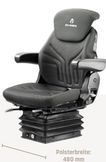
COMPACTO® COMFORT W

Ihr COMPACTO® COMFORT ist mit verschiedenen Sitzoberteilen, Polsterbreiten und Extraausstattungen lieferbar, so dass Sie ihn perfekt auf Ihr Fahrzeug abstimmen können – egal wie klein oder eng dessen Kabine konstruiert ist.