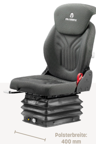
COMPACTO® COMFORT S