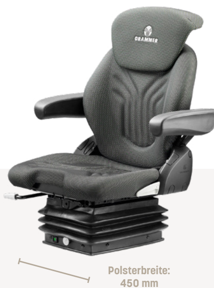
COMPACTO® COMFORT M